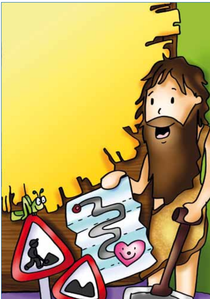
TERCER DOMINGO DE ADVIENTO. «Juan Bautista, primo de Jesús, nos dice: "Prepara el camino, pon tu corazón en obras, allana tus caminos"».