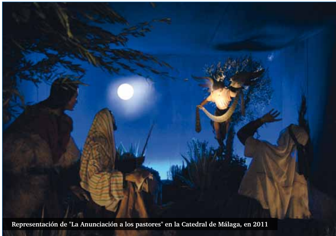
Representación de "La Anunciación a los pastores" en la Catedral de Málaga, en 2011