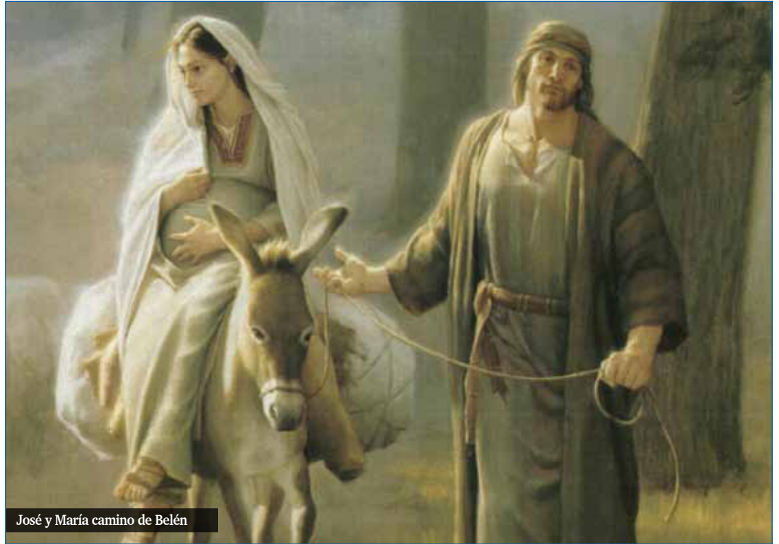
José y María camino de Belén

María debió insistir: —¿Falta mucho, José? Ha llegado el momento. Pronto el burro se paró en la parte de atrás de una posada que sólo podía ofrecer, como todo refugio, un establo donde unas bestias despertaron del lánguido sueño cuando José y María entraron. Efectivamente llegó el momento y Jesús avisó este mundo en tan inhóspito escenario y rodeado de tan irracional compañía.