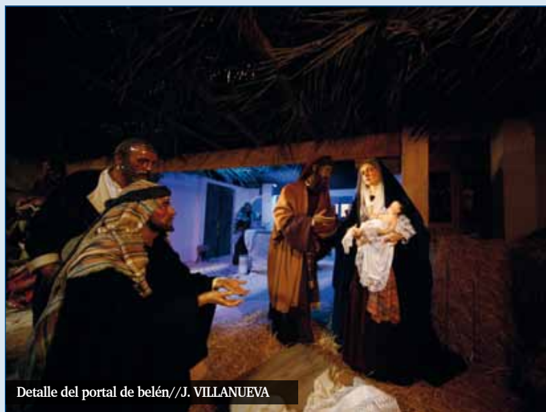
Detalle del portal de belén