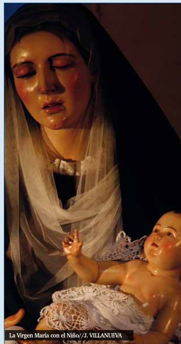
La Virgen María con el Niño//J. VILLANUEVA