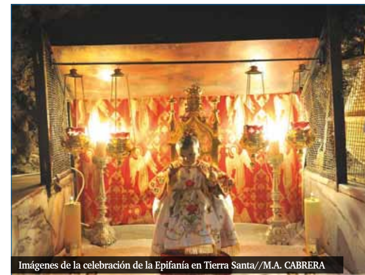
Imágenes de la celebración de la Epifanía en Tierra Santa

Aquellos reyes sabios que buscaban la verdad, fueron sorprendidos tanto por la sencillez, humildad y pobreza, como por la belleza y autenticidad de la escena de Belén. Todavía hoy se conservan intactas algunas huellas de aquella época, como la