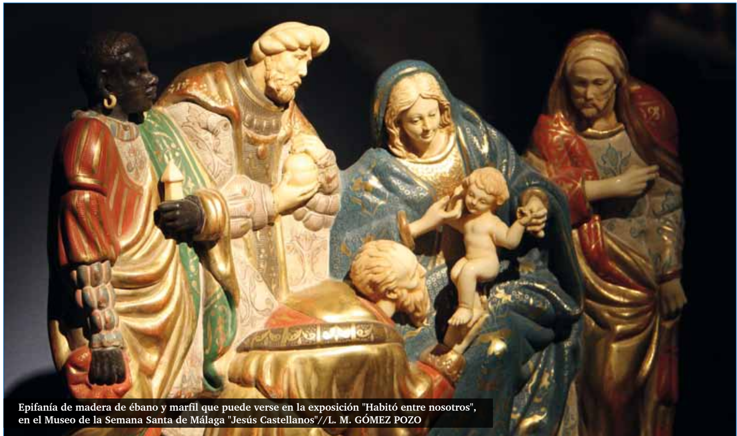
Epifanía de madera de ébano y marfil que puede verse en la exposición "Habitó entre nosotros", en el Museo de la Semana Santa de Málaga "Jesús Castellanos"