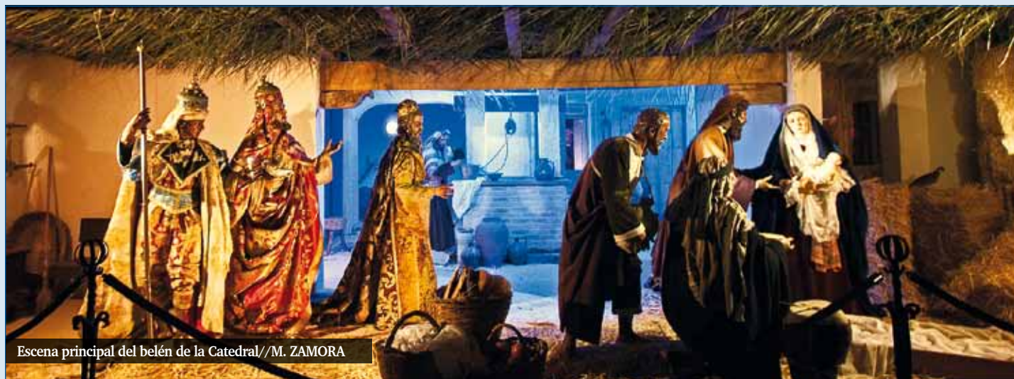
Escena principal del belén de la Catedral