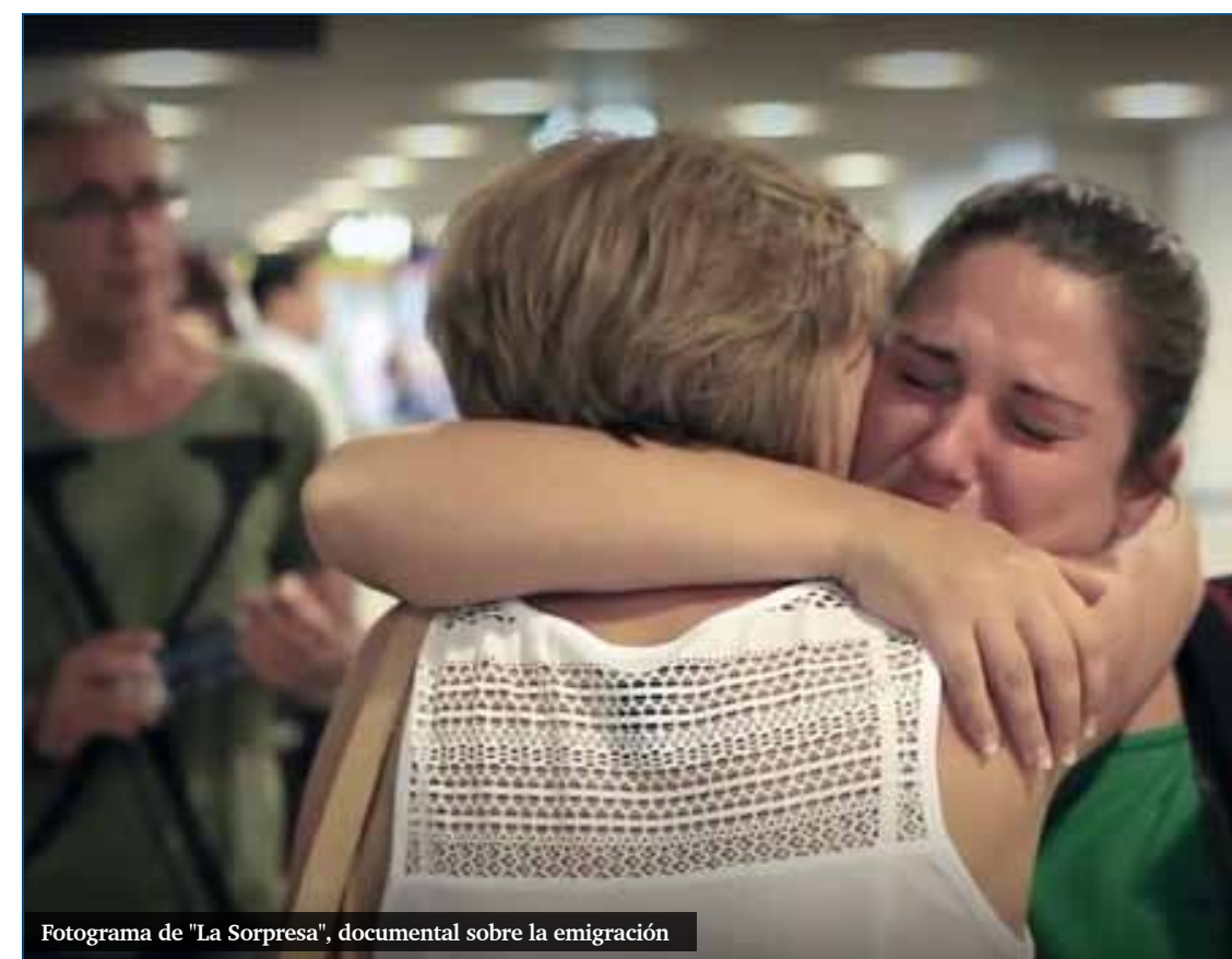
Fotograma de "La Sorpresa", documental sobre la emigración