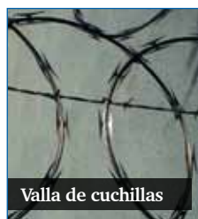
Valla de cuchillas