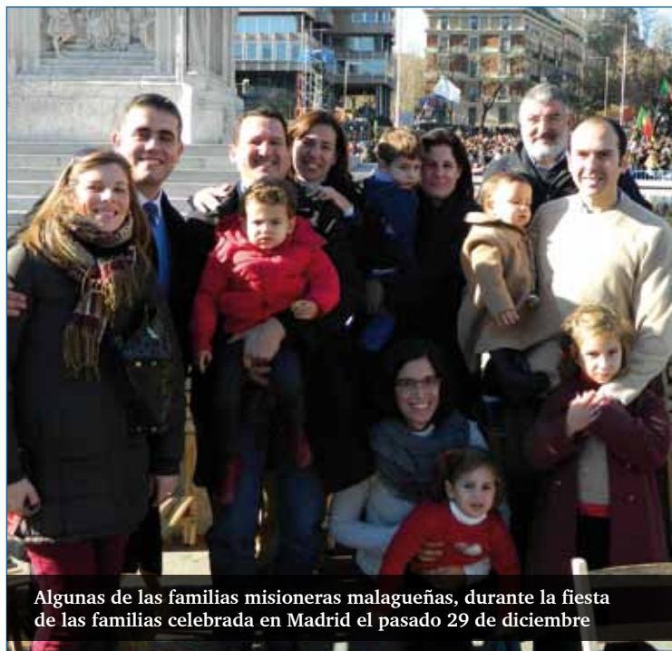
Algunas de las familias misioneras malagueñas, durante la fiesta de las familias celebrada en Madrid el pasado 29 de diciembre