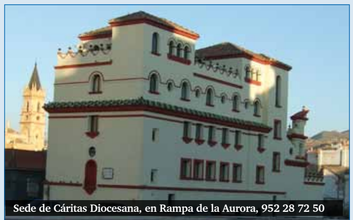
Sede de Cáritas Diocesana, en Rampa de la Aurora, 952 28 72 50

Las personas que llegan a este servicio llegan derivadas por las Cáritas parroquiales y los centros sociales de Cáritas. Se trata de un trabajo de comunión dentro de la Iglesia de Málaga. Como afirma el director de Cáritas, «hay que celebrarlo, pues las instituciones eclesiales del campo sociosanitario se coordinan para dar un mejor servicio a las personas más necesitadas, las excluidas y más vulnerables. Se aúna así la experiencia de las Hermanas Hospitalarias en el campo psico-sanitario con la trayectoria de Cáritas de cercanía a las personas en exclusión social. Es la comunión de las instituciones religiosas por el bien de los más pobres, la expresión de la Caridad de la Iglesia con los hermanos más necesitados».