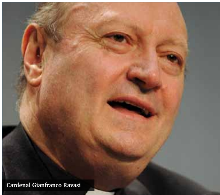
Cardenal Gianfranco Ravasi

–Tenemos que estar atentos a no juzgar los elementos blasfemos que se encuentran en algunas películas como si fueran sólo negativos. A veces reflejan esa nostalgia, el deseo de encontrar algo que se ha perdido. De ahí que, los directores y guionistas se ofendan, y critiquen. El cine