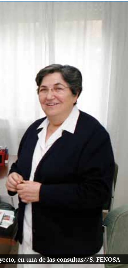
...yecto, en una de las consultas//S. FENOSA

▼ «Se une la experiencia de las Hermanas Hospitalarias en el campo psico-sanitario con la trayectoria de Cáritas de cercanía a las personas en exclusión social» ▲