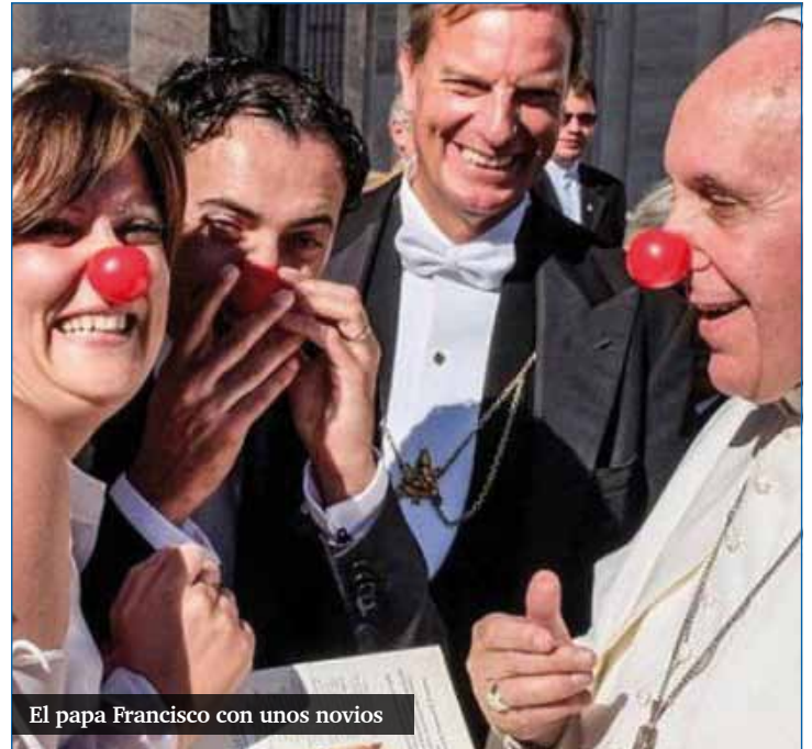
El papa Francisco con unos novios