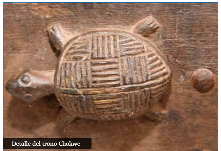
Detalle del trono Chokwe

Las piezas más antiguas son las terracotas, gracias a las cuales tenemos representadas cuatro culturas que no existen hoy día,