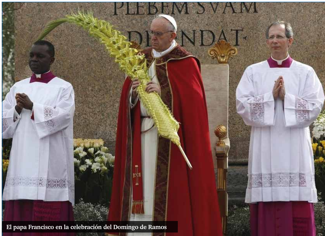
El papa Francisco en la celebración del Domingo de Ramos

Ante todo, nos dicen cuál es el estilo de Dios. Dios no se revela mediante el poder y la riqueza del mundo, sino mediante la debilidad y la pobreza: «Siendo rico, se hizo pobre por vosotros...». Cristo, el Hijo eterno de Dios, igual al Padre en poder y gloria, se hizo pobre; descendió en medio de nosotros, se acercó a cada uno de nosotros; se desnudó, se «vacío», para ser en todo semejante a nosotros (cfr. Flp 2, 7; Heb 4, 15). ¡Qué gran misterio la encarnación de Dios! La razón de todo esto es el amor divino, un amor que es gracia, generosidad, deseo de proximidad, y que no duda en darse y sacrificarse por las criaturas a las que ama. La caridad, el amor es compartir en todo la suerte del amado. El amor nos hace semejantes, crea igualdad, derriba los muros y las distancias. Y Dios hizo esto con nosotros. Jesús, en efecto, «trabajó con manos de hombre, pensó con inteligencia de hombre, obró con voluntad de hombre, amó con corazón de hombre. Nacido de la Virgen María, se hizo verdaderamente uno de nosotros, en todo semejante a nosotros excepto en el pecado» (Conc. Ecum. Vat. II, Const. past. Gaudium et spes, 22).