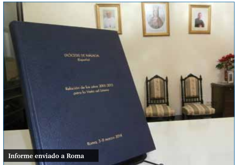
Informe enviado a Roma

En palabras de Pablo VI, "como toda visita, se trata de un encuentro, una ocasión para hablar, para estar juntos, para intercambiar en el nombre de Cristo el beso de la paz". Es una ocasión para la comunión eclesial, la cole-