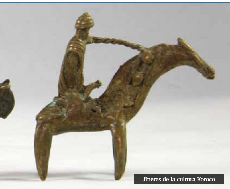
Jinetes de la cultura Kotoco