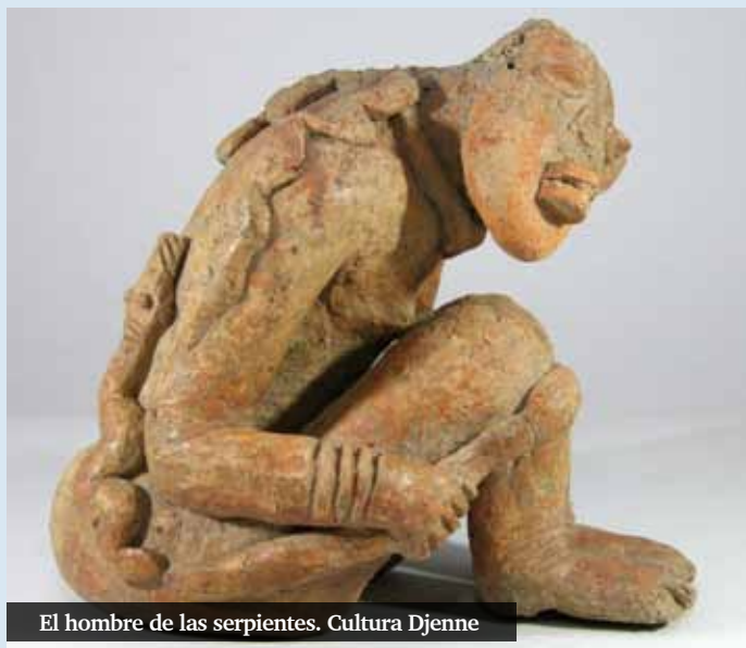
El hombre de las serpientes. Cultura Djenne