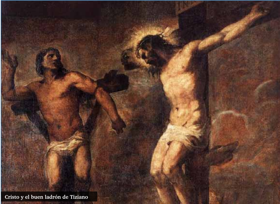
Cristo y el buen ladrón de Tiziano

un pueblo de pobres. La riqueza de Dios no puede pasar a través de nuestra riqueza, sino siempre y solamente a través de nuestra pobreza, personal y comunitaria, animada por el Espíritu de Cristo.