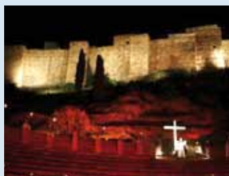
Desde 2012 se celebra cada año en el Teatro Romano de Málaga un vía crucis en el que participan periodistas