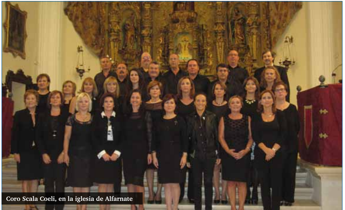
Coro Scala Coeli, en la iglesia de Alfarnate

La iniciativa de poner en marcha el coro Scala Coeli surgió hace ya casi cinco años como un deseo de un grupo de amigos de Alfarnate. Poco a poco se fue agregando más gente y en la actualidad, lo forman 34 miembros. Entre ellos hay de todo, mayoritariamente docentes, pero también empleados de banca, de la construcción, amas