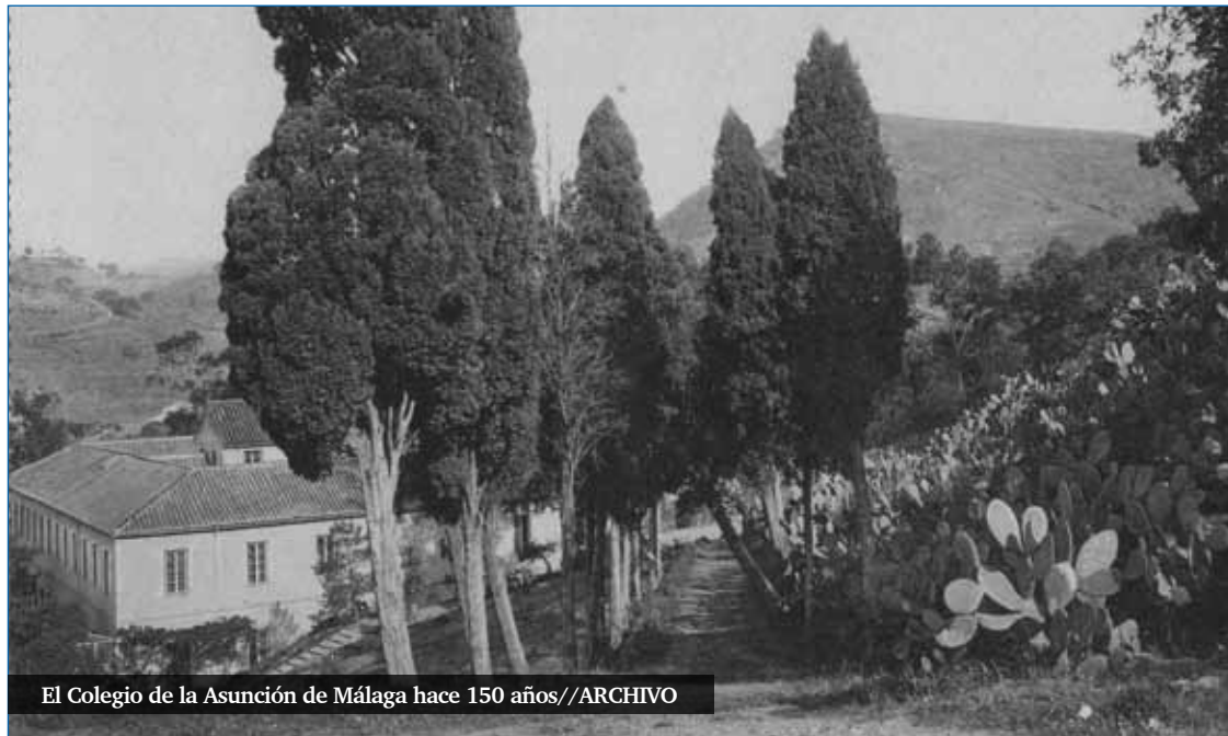
El Colegio de la Asunción de Málaga hace 150 años