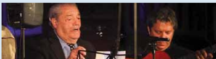
El 18 de noviembre de 2013 tuvo lugar la presentación del proyecto "Desde lo hondo" en la Catedral. Un oratorio flamenco cuyos beneficios se destinan a Cáritas Diocesana de Málaga