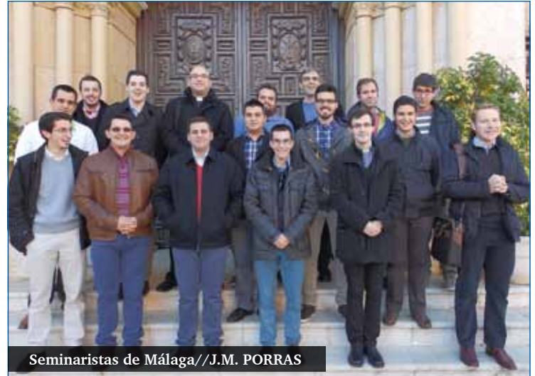
Seminaristas de Málaga

Durante la Campaña Vocacional los seminaristas visitarán las comunidades parroquiales y centros de estudios y también pueden traer a los chicos y chicas de los grupos y colegios, a las Jornadas