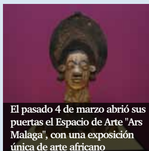
El pasado 4 de marzo abrió sus puertas el Espacio de Arte "Ars Malaga", con una exposición única de arte africano

En los últimos años, son varias las iniciativas que han surgido en la Diócesis de Málaga en favor de la evangelización a través de la cultura, del diálogo entre la fe y la cultura, que han sido recogidos en el informe de la Visita "Ad Limina". Son propuestas de atrio de los gentiles, como la que tendrá lugar la próxima semana, organizada por Pastoral Universitaria bajo el lema "¿De dónde venimos? ¿Adónde vamos?", cuyo programa es el siguiente: