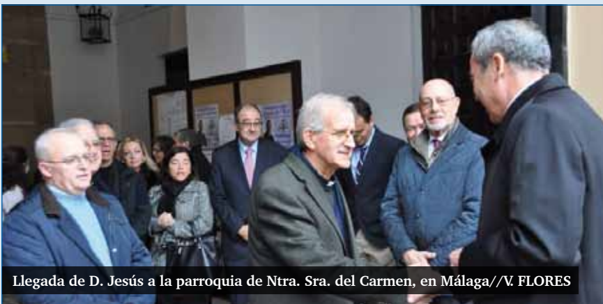
Llegada de D. Jesús a la parroquia de Ntra. Sra. del Carmen, en Málaga