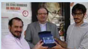
En mayo de 2013 se celebró el I Ciclo Málaga Cine Humano para de promover el cine sobre la dignidad de la persona