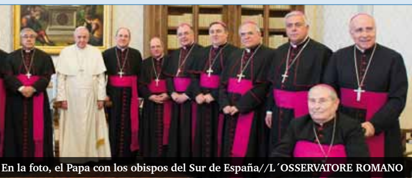
En la foto, el Papa con los obispos del Sur de España