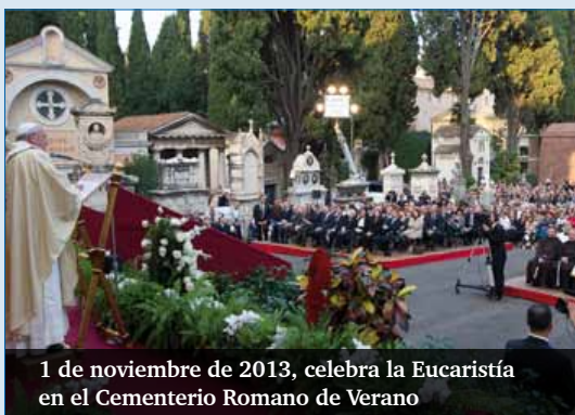
1 de noviembre de 2013, celebra la Eucaristía en el Cementerio Romano de Verano