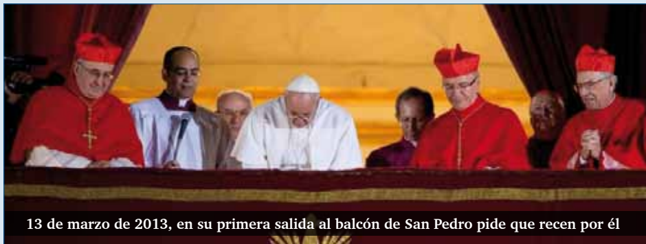
13 de marzo de 2013, en su primera salida al balcón de San Pedro pide que recen por él