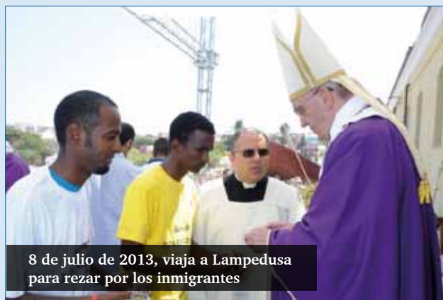
8 de julio de 2013, viaja a Lampedusa para rezar por los inmigrantes