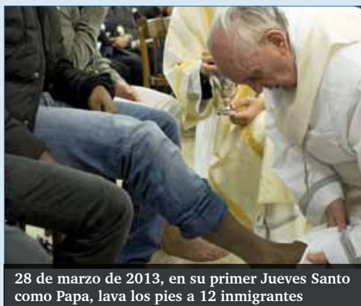
28 de marzo de 2013, en su primer Jueves Santo como Papa, lava los pies a 12 inmigrantes