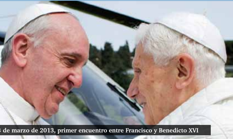
16 de marzo de 2013, primer encuentro entre Francisco y Benedicto XVI