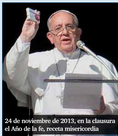
24 de noviembre de 2013, en la clausura el Año de la fe, receta misericordia