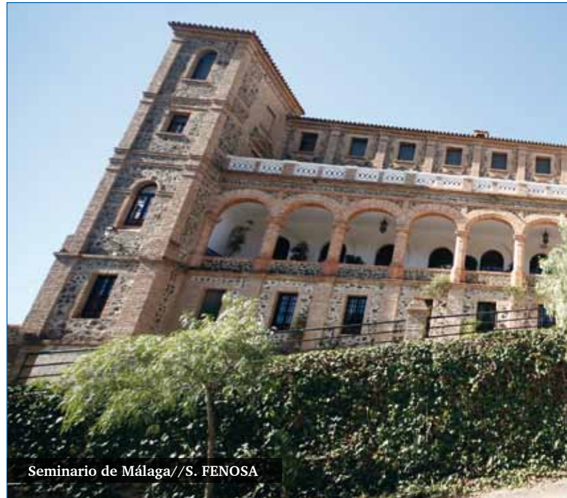
Seminario de Málaga