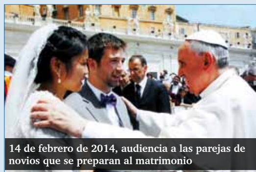
14 de febrero de 2014, audiencia a las parejas de novios que se preparan al matrimonio