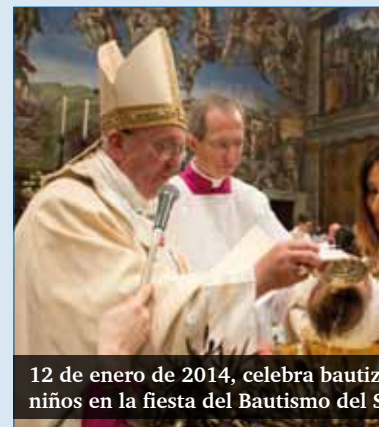
12 de enero de 2014, celebra bautizos niños en la fiesta del Bautismo del Señor