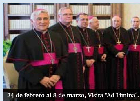
24 de febrero al 8 de marzo, Visita "Ad Limina".