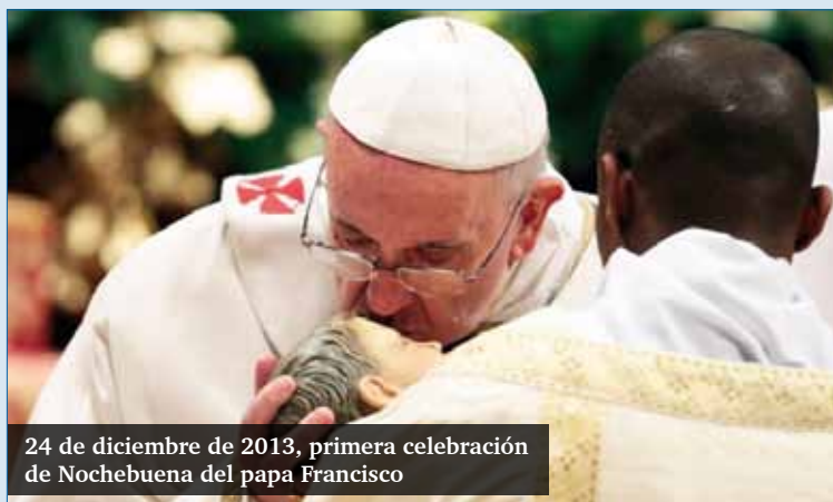
24 de diciembre de 2013, primera celebración de Nochebuena del papa Francisco