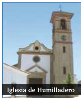
Iglesia de Humilladero

La parroquia de Humilladero acoge el próximo sábado, 22 de marzo, el Encuentro Arciprestal de Cáritas. Profundizarán en la presencia profética de Cáritas en los pueblos que forman el arciprestazgo de Archidona-Campillos, tema que están trabajando durante el curso en cada parroquia.