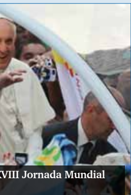
VIII Jornada Mundial