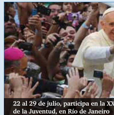
22 al 29 de julio, participa en la XXV de la Juventud, en Río de Janeiro