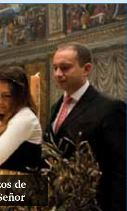
os de Señor