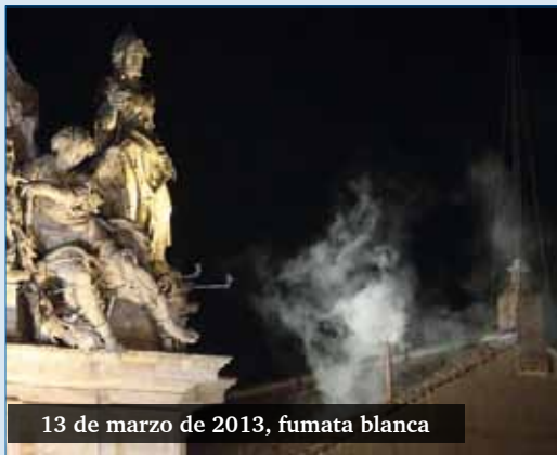
13 de marzo de 2013, fumata blanca