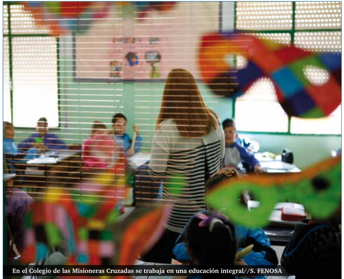
En el Colegio de las Misioneras Cruzadas se trabaja en una educación integral

«¡A ver si tengo suerte y entra mi niña!» dice un vecino del barrio en la puerta del colegio a su director. Y es que, en la actualidad, el colegio cuenta con una línea de educación infantil, primaria y secundaria, y sus plazas están muy solicitadas. Es todo un referente en la barriada, pero quedan aún retos por superar, entre los que destacan el absentismo y el fracaso escolar. El primero de ellos se trabaja con el seguimiento de los tutores, la vinculación con servicios sociales y la fiscalía. Pero la