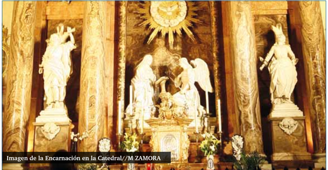
Imagen de la Encarnación en la Catedral

“Que nuestra Catedral esté dedicada a la Encarnación supone que está dedicada al misterio principal de nuestra fe católica, la Encarnación del Hijo de Dios que siendo Dios, se hace hombre, padece y muere por salvarnos, “para darnos ejemplo de vida”, decía el catecismo antiguo que yo estudiaba. Es el fundamento de nuestra religión: la Encarnación del Hijo de Dios en la entrañas de la Virgen María. De ahí viene el origen del cristianismo”.