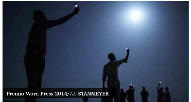
Premio Word Press 2014

La miseria moral de aquellos que utilizan este drama humano para su propio enriquecimiento. Las mafias que se dedican al tráfico de personas, los traficantes de armas, las corporaciones que alientan estos conflictos para hacerse con el control de las materias primas, la actitud pasiva de la Unión