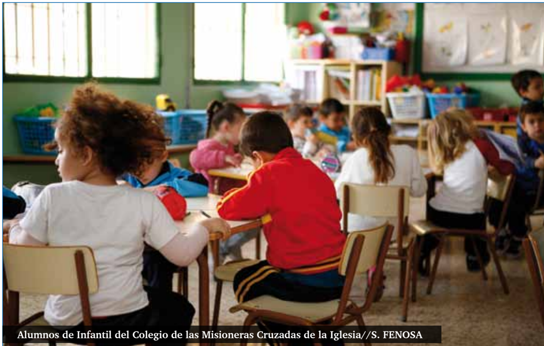
Alumnos de Infantil del Colegio de las Misioneras Cruzadas de la Iglesia