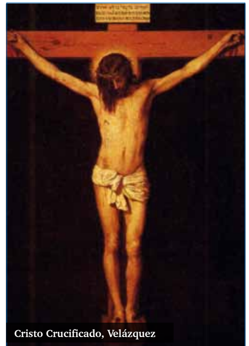
Cristo Crucificado, Velázquez

A lo largo de estos versos, la palabra de Unamuno dibuja, colorea, realza, destaca -como el pincel de Velázquez- la "Cabeza", la "Melena", la "Frente", el "Rostro", el "Cuerpo", etc. El espíritu trasciende de cada parte, de cada miembro, en esta descripción místi-