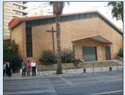
El Seminario, el convento de las Capuchinas, Cottolengo y la parroquia de San Gabriel fueron algunos de los lugares que abrieron sus puertas a este proyecto

«Muchos de los "enganchados" y sus familias, que pisaban por primera vez una iglesia, se quedaban alucinados con la acogida del cura, el interés por conocer sus problemas, y las ayudas en ropas y alimentos»