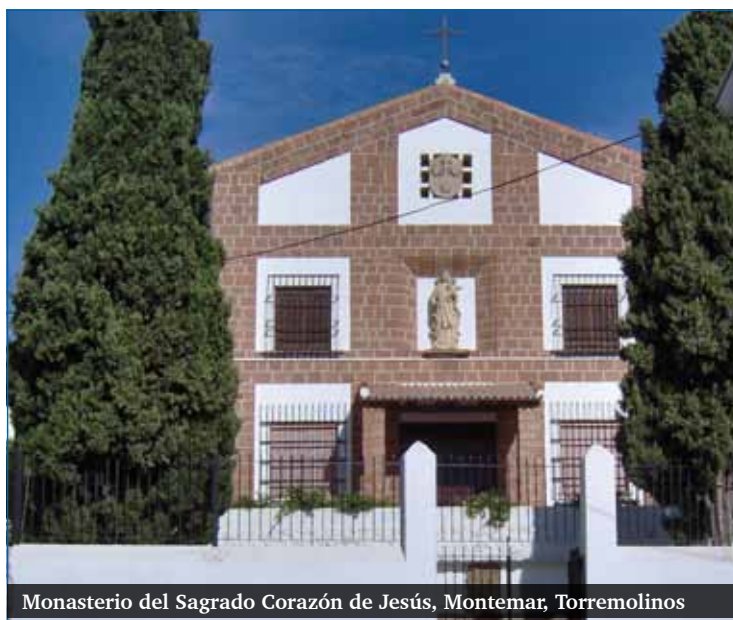
Monasterio del Sagrado Corazón de Jesús, Montemar, Torremolinos

El Carmelo lleva una vida contemplativa, una vocación que sigue