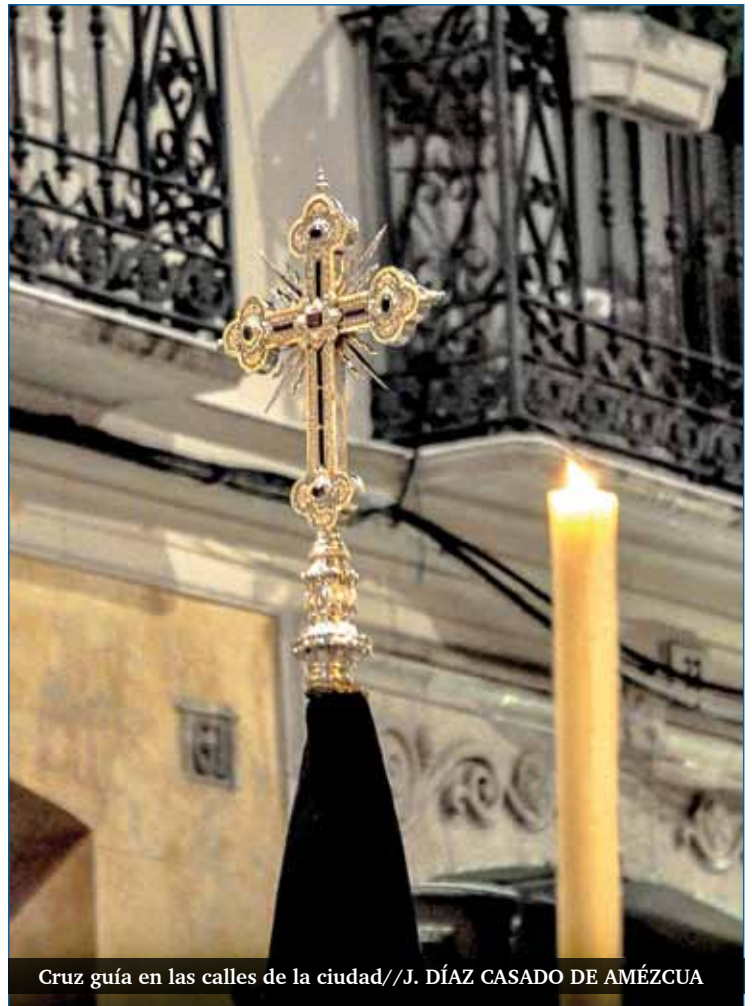
Cruz guía en las calles de la ciudad//J. DÍAZ CASADO DE AMÉZCUA

El tiempo santo que se pregona exige una vivencia de fe y coherencia. También para el pregonero que no es un mero transmisor de vivencias y emociones. Es el momento de compartir experiencias vitales cofrades y consecuentemente cristianas. Es el tiempo propicio para hablar de la propia realidad de las cofradías, de su compromiso con la fe y la sociedad. Es el momento de poner en valor la vivencia pública de la fe. El pregón es una oportunidad que te ofrece la vida para, a la salud de los chismosos, transmitir la verdad que nos hace libres: Jesucristo.