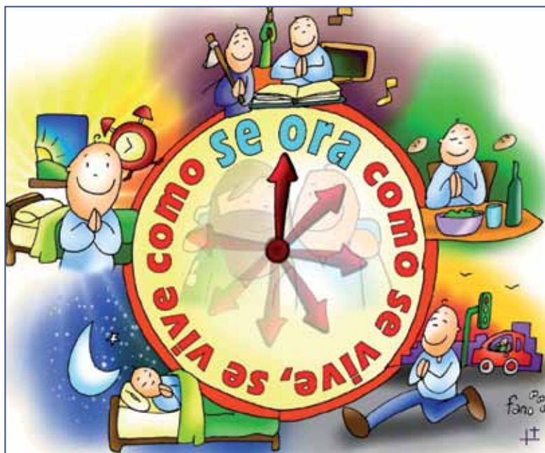
Detalle del cartel del Día de la Catequesis