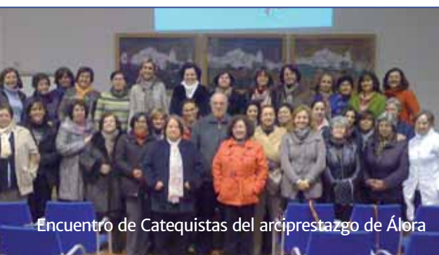
Encuentro de Catequistas del arciprestazgo de Álora

Las parroquias celebran este domingo el Día de la Catequesis