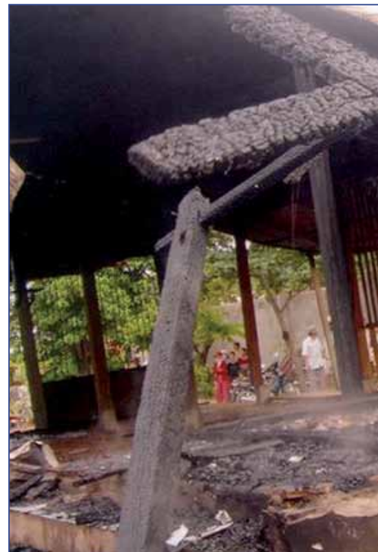
Miembros de la parroquia de Me Vo Nhiem (Vietnam)

La Iglesia es comunio sanctorum porque en ella participan los santos, pero a su vez porque es comunión de cosas santas: el amor de Dios que se nos reveló en Cristo y todos sus dones. Entre éstos está