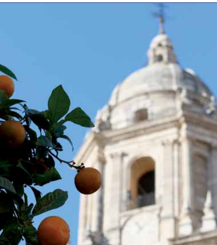
➔ S. FENOSA