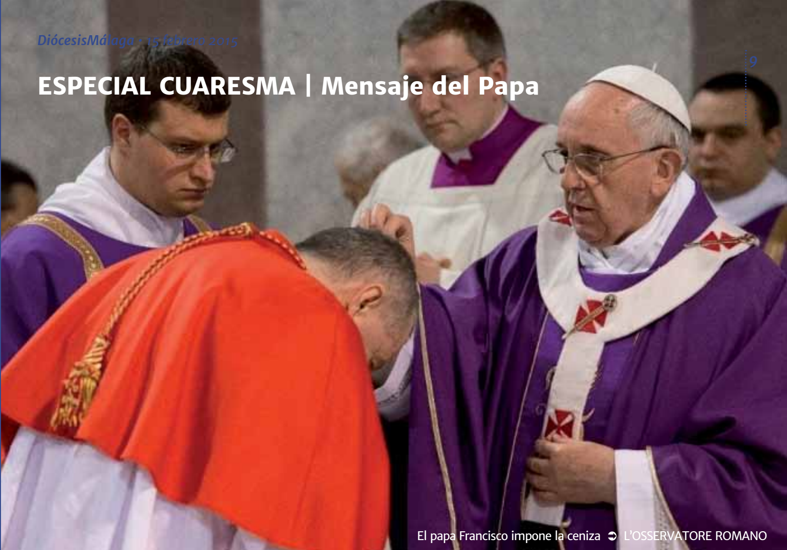
El papa Francisco impone la ceniza