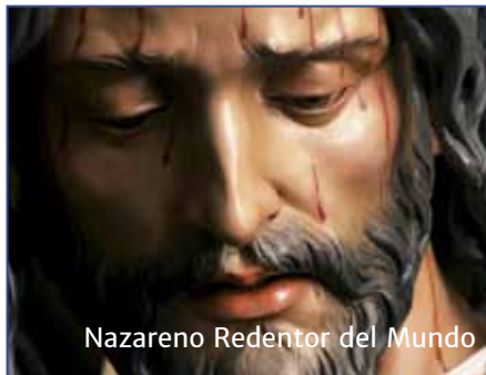
Nazareno Redentor del Mundo

Está previsto que el viernes 13 de febrero, a partir de las 20.00 horas, la bendita imagen del Nazareno Redentor del Mundo presida el ejercicio del Via Crucis por las calles de la feligresía de la Encarnación.