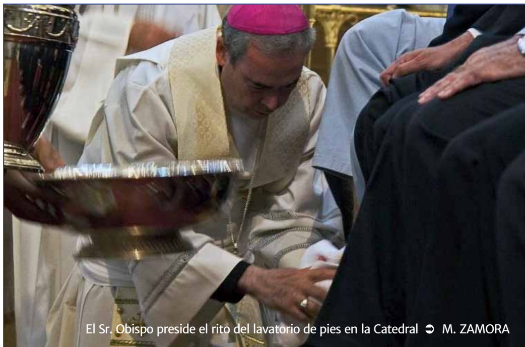
El Sr. Obispo preside el rito del lavatorio de pies en la Catedral

«La Cuaresma es un tiempo propicio para mostrar interés por el otro, con un signo concreto, aunque sea pequeño»