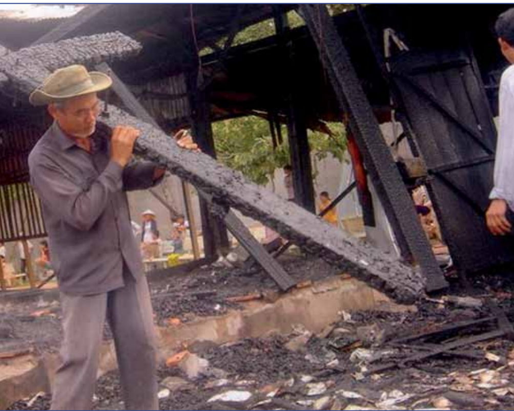
am), retiran los restos calcinados tras un atentado ➔ Ayuda a la Iglesia Necesitada

cargo de ellos? ¿O nos refugiamos en un amor universal que se compromete con los que están lejos en el mundo, pero olvida al Lázaro sentado delante de su propia puerta cerrada? (cf. Lc 16,19-31).