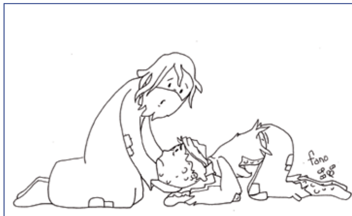
«Sintió compasión de él...»