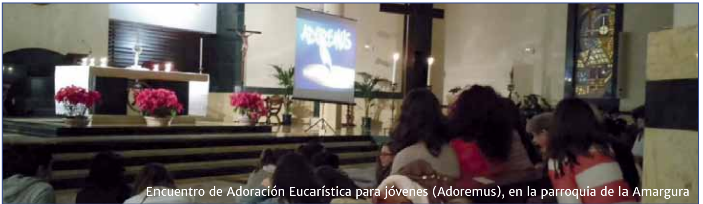
Encuentro de Adoración Eucarística para jóvenes (Adoremus), en la parroquia de la Amargura